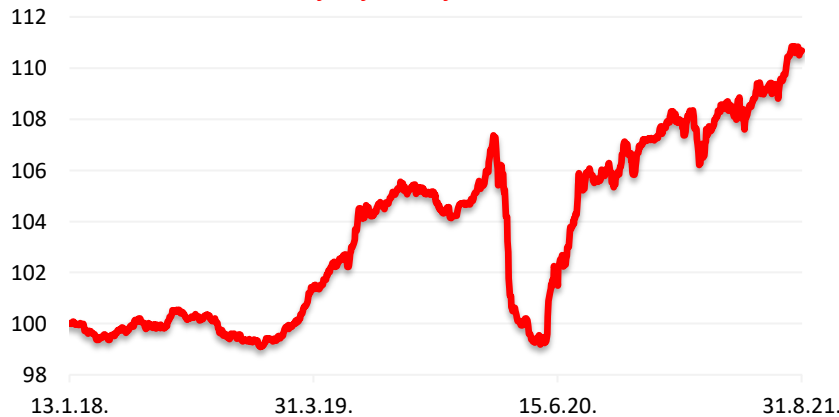
Kretanje cijene udjela HPB Bond Plus fonda

Cilj fonda je ostvarivanje porasta vrijednosti udjela kroz duži vremenski period sa ciljanom strukturom ulaganja sredstava primarno u obveznice i depozite te manjim dijelom u dionice, uvažavajući načela sigurnosti, raznolikosti i likvidnosti ulaganja imovine Fonda te prilagođavajući investicijsku politiku situaciji na tržištu. Pri ulaganju sredstava Fonda, Društvo će se pridržavati ograničenja iz Zakona i podzakonskih propisa. Fond će prikupljena sredstva ulagati u financijske instrumente isključivo čiji je izdavatelj ili za koji jamči Republika Hrvatska, države članice EU i OECD i čiji je izdavatelj iz Republike Hrvatske, države članice EU i OECD. Društvo koristi aktivnu strategiju upravljanja Fondom, uz potpunu diskreciju ulaganja imovine Fonda te ne koristi referentne vrijednosti (benchmark).